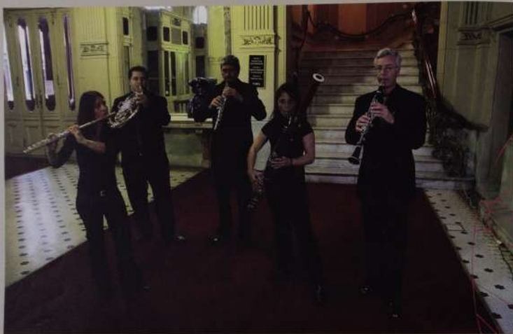
De cámara. La Sociedad de los Cinco Vientos