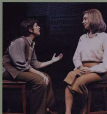
El encuentro Silvina Ocampo – Alejandra Pizarnik

→ Martes 21 a las 21. en el Teatro Príncipe de Asturias. Gratis. Retirar entradas desde el 14 de este mes en Galerías, de martes a domingos de 15 a 20. Máximo: dos entradas por persona. No se harán reservas telefónicas ni ingresará a la sala quien no tenga su entrada. No se permitirá el ingreso de espectadores una vez colmado el aforo de la sala.