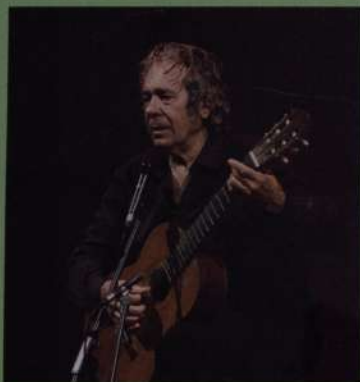
Volver a la canción