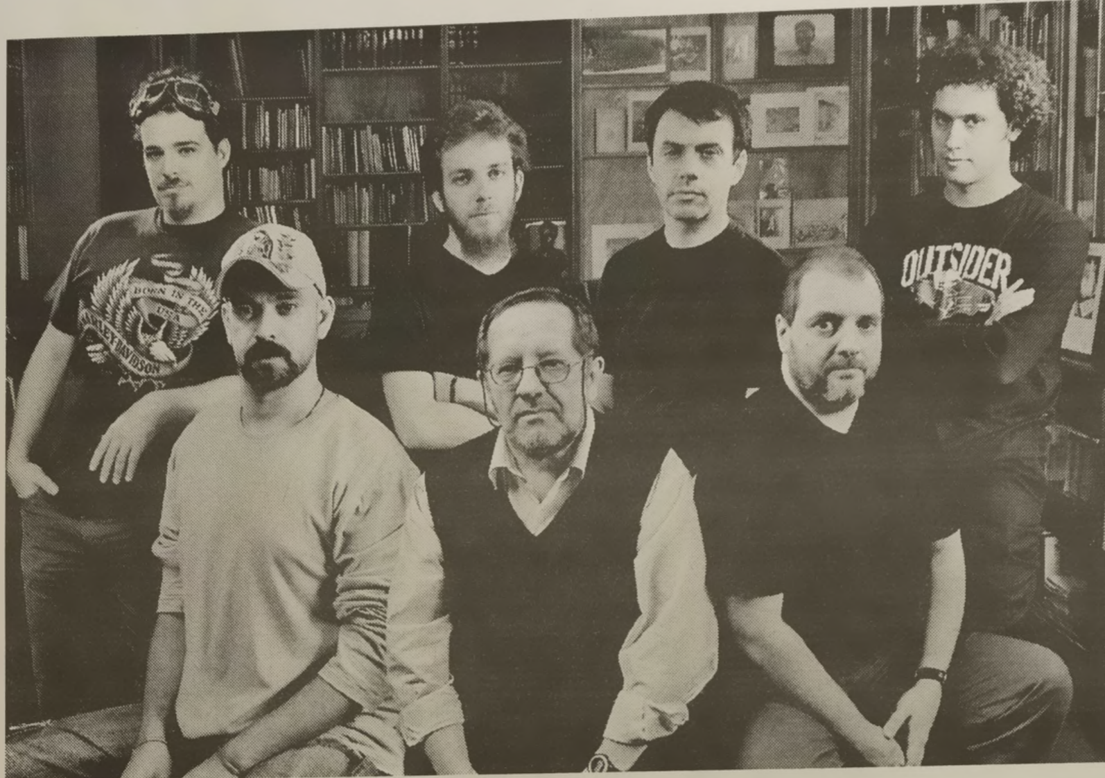
Disparos en la biblioteca. Los autores de Negro Absoluto estarán en Ross con sus libros.