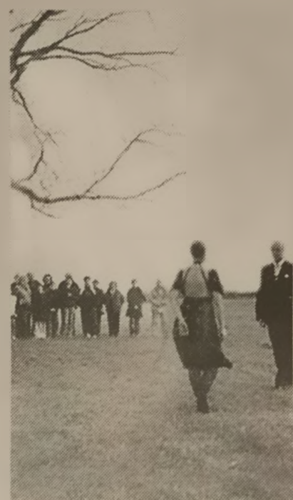
El filme. Una historia de vida.

Querido doctor refleja una historia de vida en particular pero también la de aquellos hijos de inmigrantes que se formaron tras la ilusión de "mi hijo el doctor". ○